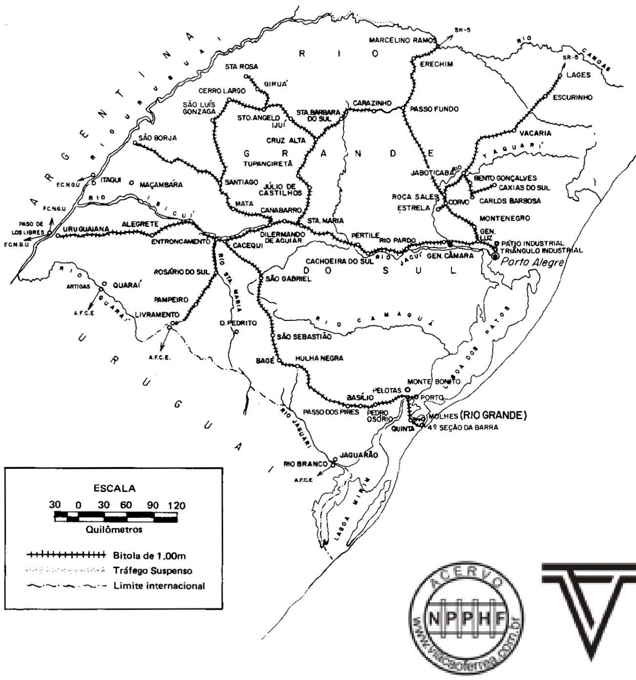
Mapa ferroviário atual do Estado do Rio Grande do Sul. Situação em 2003.